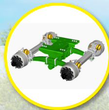
Wózek Roll-Over z osią nadążną