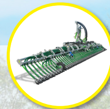
Rampa Pendislide PRO 120/48PS2