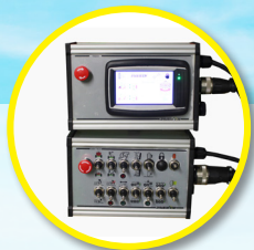
Sterowanie elektrohydrauliczne: Touch-Control